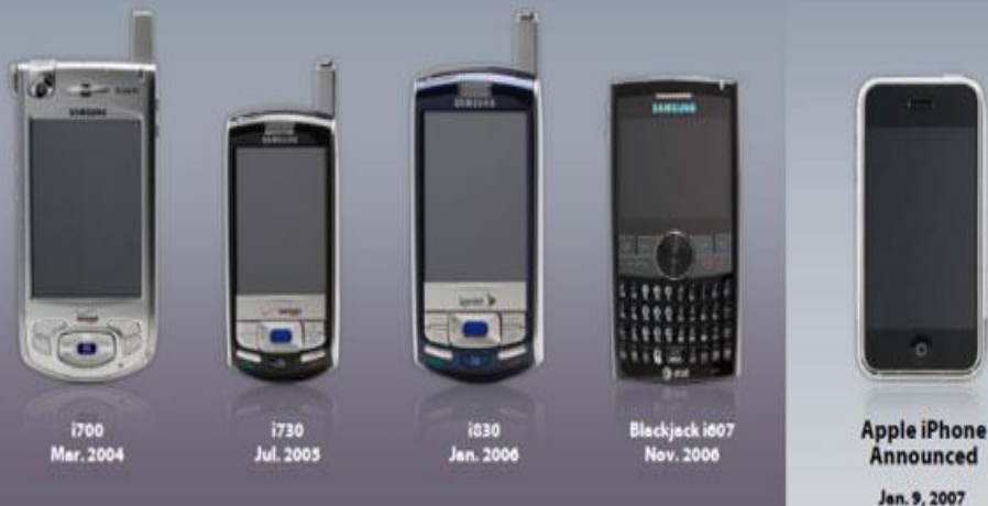
Produtos da Samsung antes do iPhone