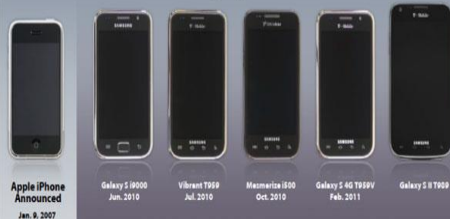
Produtos da Samsung depois do iPhone